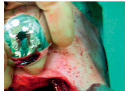
Olkaproteesin 15 cm pitkä varsi on pultattu olkaluun ydinonteloon ja asetetaan paikalleen modulaarisen proteesin nuppia, joka korvaa olkaluun pään ja josta leikkauksen jälkeen peilautuu.