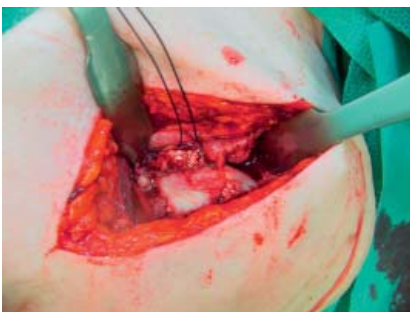
Leikkauksessa nähdään olkaluun pään nivelen ruston hävinneen lähes kokonaan.

Särky- ja liikekipu yleensä vähenevät oleellisesti niin, että VAS-janalla (visual analogue scale, jossa 0 tarkoittaa kivutonta olkaa ja 10 pahinta mahdollista kipua) päästään särkyssä luvusta 9 noin lukuun 2-3, usein parempaan. Joskus kuitenkin olkaniveleen jää jonkinlaista ahtautta, impingementiä, jolloin särky ei vähene niin hyvin ja hemiartroplastiassa saattaa jäädä jonkin verran myös särkyjä. Liikkeen suhteen aina-kaan artroosipotilailla ei yleensä päästä täyteen liikkeeseen vaan olkavarren etunosto (fleksio) on 120-130 astetta, eli reilusti yli vaakatason ja sivunosto (abduktio) 100-120 astetta, ulkokierto on ehkä 30-40 astetta ja sisäkierrossa potilas saa kätensä palkan päälle.